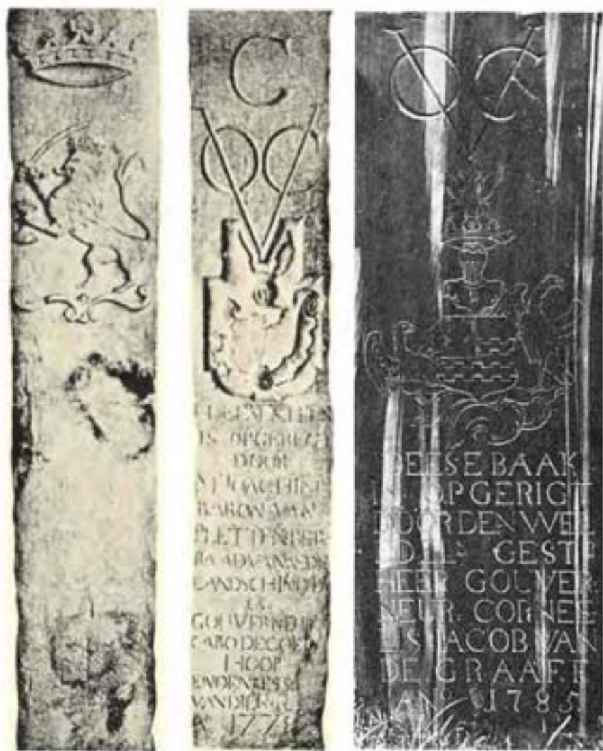
Grensbakens met die wapens van die Goewerneurs VAN PLETTENBERG en VAN DE GRAAFF.