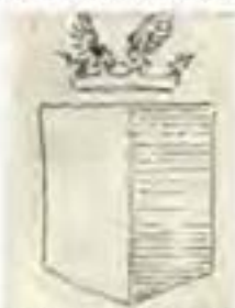
VAN PLETTENBERG. (Bell-Krynauw Versameling).

Gedeel: 1 effe goud; 2 effe blou. Helmteken: 'n goue en 'n blou vlerk ('n vlug). (61)