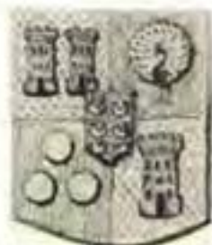
SIMON VAN DER STEL. ( Bell-Krynauw Versameling ).

Gevierendeel: 1 in goud twee rooi gekanteelde torings, naas mekaar; 2 in rooi 'n goue aansende pronkende pou; 3 in rooi drie silwer penninge, geplaas 2 en 1; 4 in goud 'n rooi gekanteelde toring. Bo-oor alles 'n hartschild van blou belaa met ses silwer sekelmane, (24) geplaas 2, 2, 2. Helmtteken: 'n toring uit die skild.