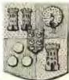
SIMON VAN DER STEL. (Bell-Krynauw Versameling).

Gevierendeel: I en IV weer gevierendeel: 1 in goud twee rooi gekanteelde torings met swart vensters en poort, naas mekaar; 2 in blou 'n pronkende pou; 3 in goud 'n rooi toring soos in I; 4 in rooi drie goue balle, geplaas