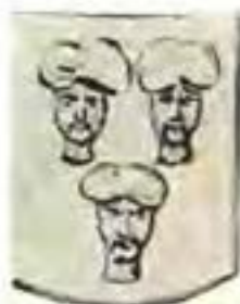
TULBAGH. (Bell-Krynauw Versameling).

Dié wapen kom in die Bell-Krynauw Versameling voor met 'n silwer veld en sal waarskynlik aan 'n roubord of monument vir die Goewerneur in die ou Kaapse Kerk ontleen wees. In die Kaapse Argief is ook 'n tekening van die volledige wapen, wat in Maart 1905, deur bemiddeling van mnr. W. G. van Oyen, „of the staff of the Archive Office there,” ontvang is. Ek beeld dit hierby af. Die veld is hier aangegee as blou en die koppe is na regs gewend. (56)