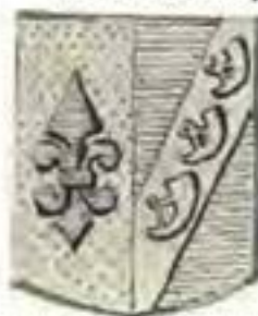
Gekombineerde wapen SWELLENGREBEL en TEN DAMME (Bell-Krynauw Versameling).

In die Bell-Krynauw Versameling is 'n afbeelding van dié Goewerneur se