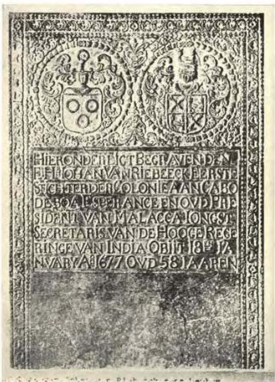
Grafskerk van Jan van Riebeeck en Maria Isaäcs Scipio, oorspronklik in Batavia, tans in die S.A. Museum, Kaapstad.