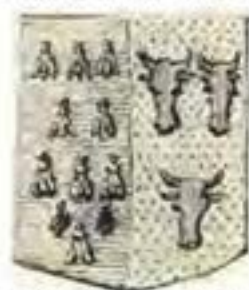
Gekombineerde wapen DE LA FONTAINE en DE MAN, (Bell-Krynauw Versameling).