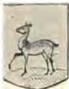
RHENIUS. (Bell-Krynauw Versameling).

In silwer 'n springende ree (hert-ooi) van natuurlike kleur, op 'n grasgrond. Helmteken: 'n geharnaste regterarm met 'n na links gerigte swaard in die ontblote hand, tussen twee stokke wat as omgekeerde kepers geplaas is, waaraan na buite waaierende, waarskynlik rooi, baniere met goue fraaiing.