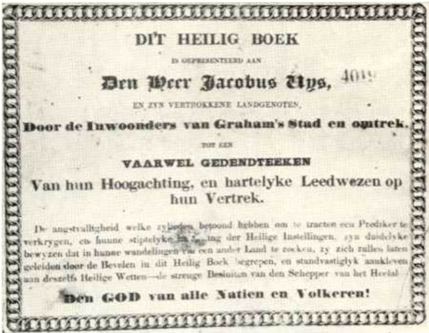
Die Inskripsie op die skutblad van die Uys-Bybel.