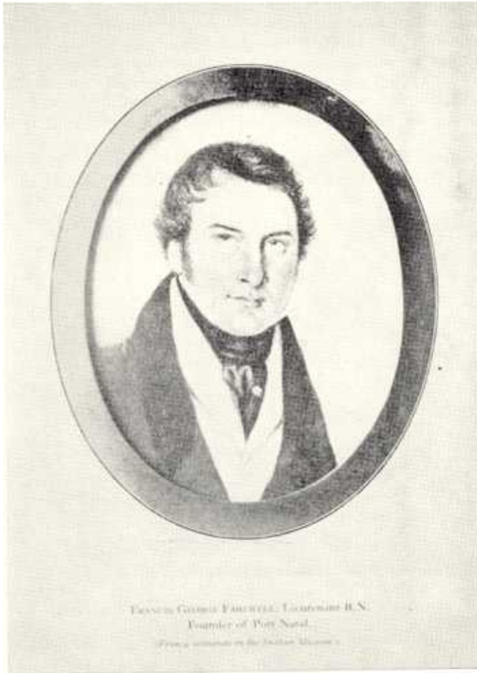
Francis George Farewell. (Uit: The Cradle Days of Natal ).

andere dat nadat die Engelse Tsjaka se kraal verlaat het, hy 'n vergadering van sy raad belê het met die doel om hulle te versoek om die blankes met die grootste agting en vriendelikheid te behandel, want „ . . . they have knowledge, and there is much we can learn from them”. 19 Dingaen was ten volle daarvan bewus dat hy besig was om grond aan die blankes af te staan en vir hom was die aanwesigheid van die Voortrekkers in Natal 'n bedreiging vir sy prestige. Hy sou hom; dus nie by die bepaling van die ooreenkoms hou nie. Tsjaka was ten tye van die koms van die Engelse na Port Natal op die toppunt van sy militêre prestige en hy het