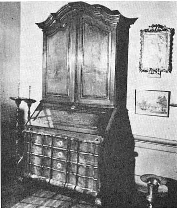
Stinkhoutskrystafel, Koopmans De Wet-Huis, Kaapstad.

Daar is trouens in die algemeen te veel oorspronklikheid van die Kaapse meubelmakers verwag. Ons praat van 'n Kaapse poot, 'n Tulbagh- of 'n Koopmansstoel. Hierdie style is egter glad nie in die Kaap uitge-