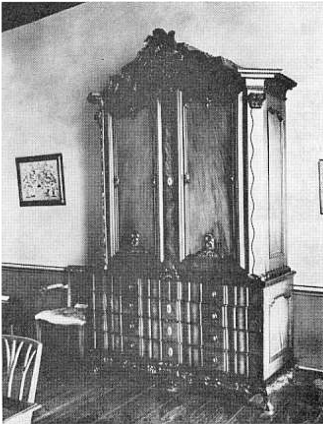
Klerekas van Satyn- en Ebbehout, Koopmans De Wet-Huis, Kaapstad.

Hoe stel 'n mens vas of 'n stoel of 'n tafel vroeër in die Kaap gemaak is, en wanneer? Watter Europese style het die vorm van dié meubels beïnvloed, was dit vir 'n huis in die dorp of vir 'n plaaswoning bestem,