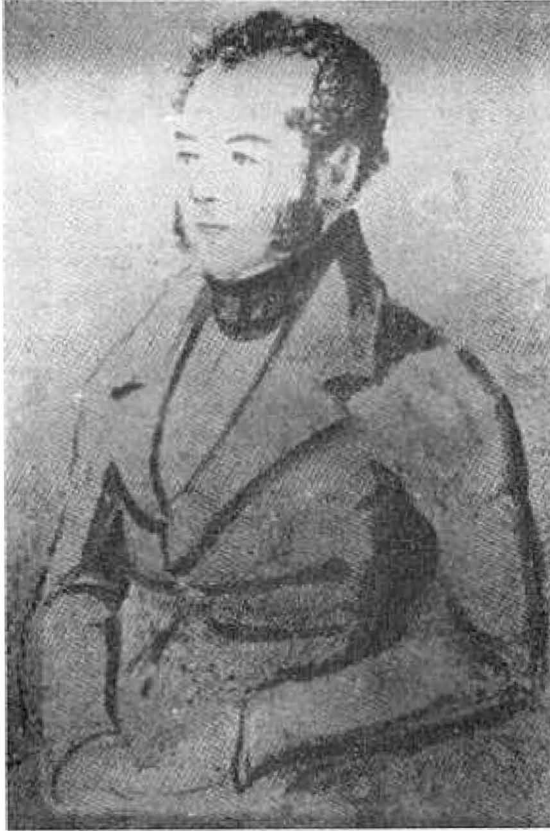
Henry Francis Fynn