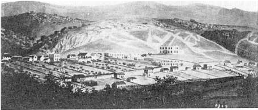
Grahamstad in 1823. Die oorspronklike drosdy met die pladdak kan in die agtergrond gesien word.

mende goewerneur se hele skema het in duie geëstort — tot groot verligting van die inwoners van Grahamstad en tot groot teleurstelling van die inwoners van Bathurst.