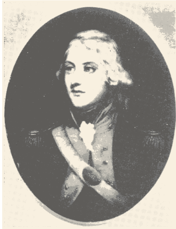
Kolonel John Graham na wie Grahamstad vernoem is.

Aan die begin was die garnisoen in Grahamstad maar klein. Daar was in die vallei twee redelike forte, die een bekend as die East Barracks, wat geleë was op die terrein waar die sielsiekehospitaal vandag staan. Verder was daar nog hoër op in die vallei drie kleiner forte en 'n paar swakgeboude huise. Grahamstad was slegs 'n militêre pos in die ware sin van die woord en niks meer nie; van strate en ander dorpsgeriewe was daar geen sprake nie en bosse en bome het die paar geboue van mekaar geskei.