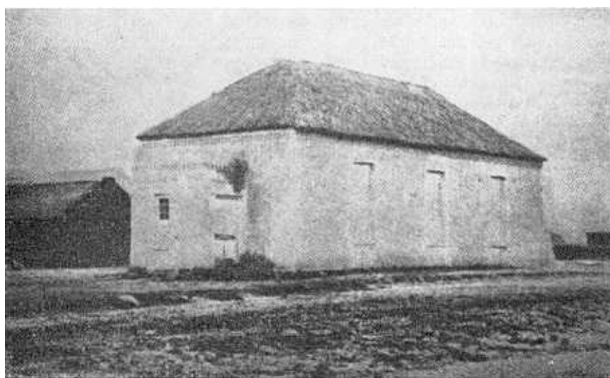
Die Eerste Wesleyaanse Kerkie in Bloemfontein, Opperig 1867-68.