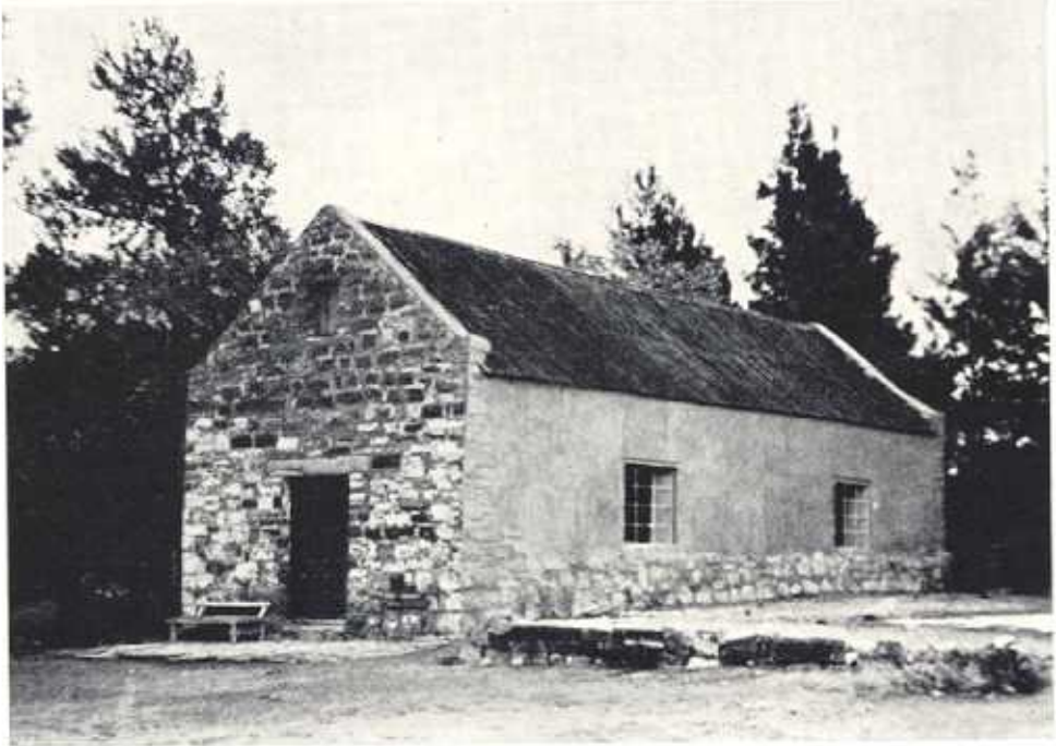
Die kerkie soos dit vandag daar uitsien.

So het hierdie ou kerkie dan die wisselvallighede en storms van die tyd getrotseer en vandag staan dit daar as 'n eenvoudige monument wat as 't ware uit die omgewing gegroei het en daarmee een is.