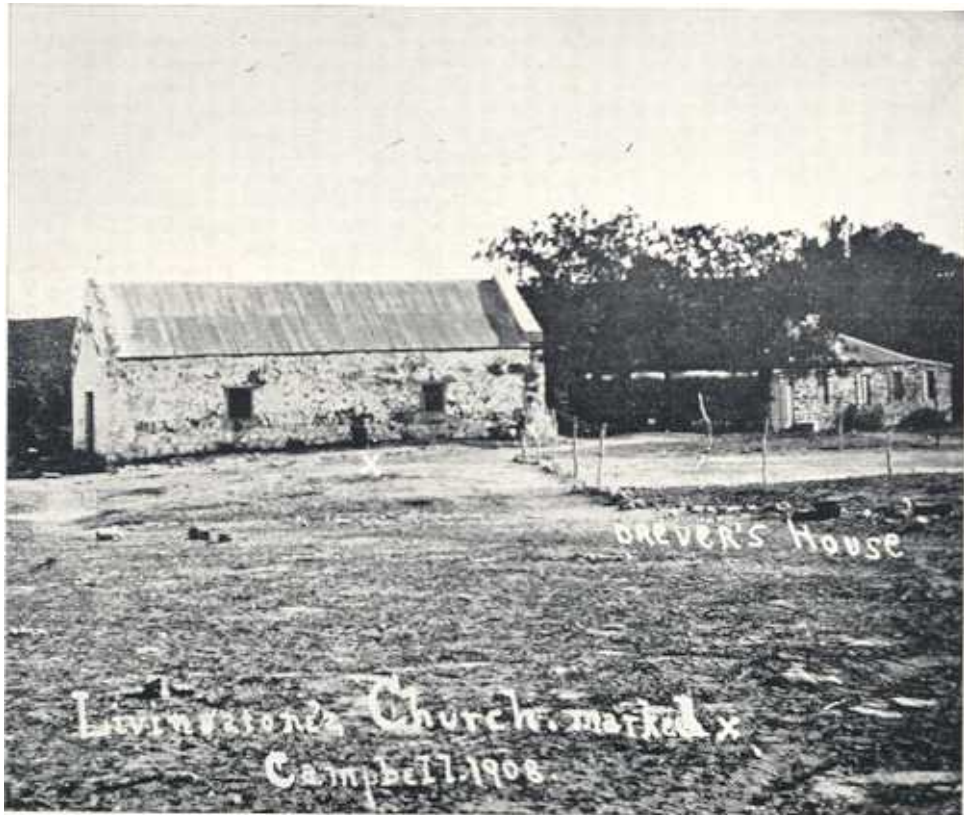
Aartsdeken Lawson se poskaart, 1908.

van die ou kerkgeboutjie verbyster, maar deur onlangse opgrawinge is 'n gedeelte van die fundamente van die ou pastorie blootgelê. Dit het ou inwoners nou ook bygeval dat met die bou van 'n tennisbaan aan die einde van die laaste eeu 'n deel van die fondamentklippe daarvoor gebruik is.