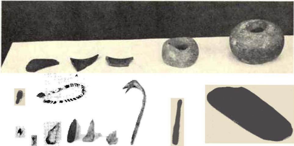
Argeologiese materiaal wat in die versameling aangetref word.