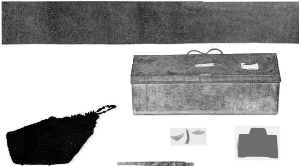
Voorbeelde van materiaal wat die leerlinge self versamel het.

By die Hoër-Seunskool te Oudtshoorn is daar ongeveer vier jaar gelede begin met die opbou van so 'n museum. Vrywillige bydraes het van die begin af ingestroom en etlike van die skenkings is as so waardevol beskou dat die skenkers aangeraai is om dit liever aan die een of ander groot museum te bemaak. Met meer aanmoediging het die museum so gegroei dat daar aandag aan 'n klassifisering gegee moes word. Die klassifisering het dan ook afgehang van die voorwerpe wat ons reeds in ons besit gehad het. Die vyf hoofgroepe was dan: