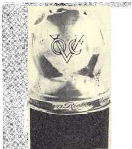
Wandestok van Van Riebeeck, ook genoemd Commandostaf van 1658.

Hoe lang hij in Transvaal gebleven is, is niet met zekerheid te zeggen; alleen weten wij, dat hij in 1927 in Nederland aanwezig was en in Amsterdam de firma Zwets en Zeitlinger bezocht, een