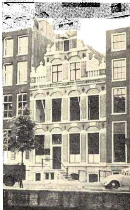
Van Riebeeckhuis, Keizersgracht 141, Amsterdam; zetel van de Ned. Z.Afr. Vereeniging en de Stichting „Moederland”.