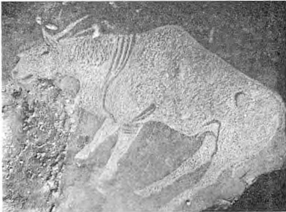
„Meester van Hartsriviervallei”. Rotsgraving van 'n Eland (Ou Transvaalse Museum).

Battiss het in hierdie twee tegnieke al twee sogenaamde „Meesters” ontdek. Van die graveerder, die „Meester van Hartsrivier”, is daar slegs enkele graverings in die Hartsriviervallei ontdek. Vergelyk die eland soos hier weergegee as 'n voorbeeld van sy werk. Die uitstaande kunstenaar van die rotsskilderinge is