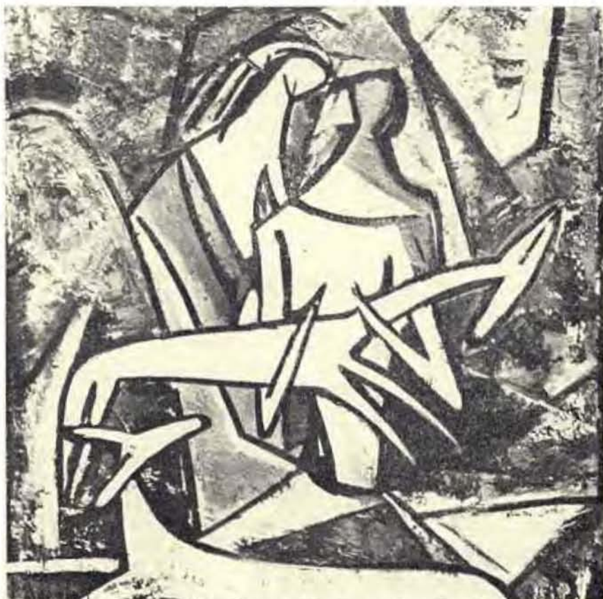
Walter Battiss: „The Young Fawn”.

I N teenstelling met die vroeëre meer wetenskaplike en illustratiewe weergawes van die skilderkuns van kunstenaars wat die wildedier voor 1900 uitgebeeld het, vind ons vandag ’n meer persoonlike benadering van hierdie onderwerp. Vroeër is die leeu, olifant, renoster of bok geskiet, gemeet, geteken en daarna afgeslag. Dit was almal studies om meer kennis omtrent die toe minder bekende diereryk van ons land te help versamel. Ons kunstenaars van vandag ken hierdie diere. Hulle weergawes is dus meer ’n uiting van hul eie gevoelens en indrukke. Dit is meer ’n moderne kunssiening; en dit gaan beslis om die kuns self.