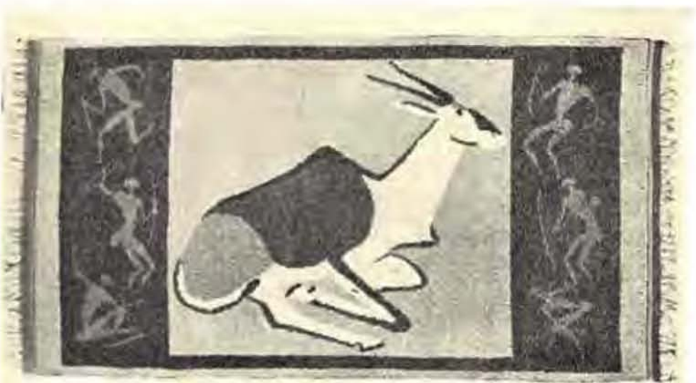
Erich Mayer: Tapytontwerp.

hoofteema in sy matontwerpe is in die meeste gevalle een of ander gestileerde boksoort. Die kunstenaar het ook ontwerpe vir teëls gedoen, maar het hom egter nie baie daarop toegelê nie.