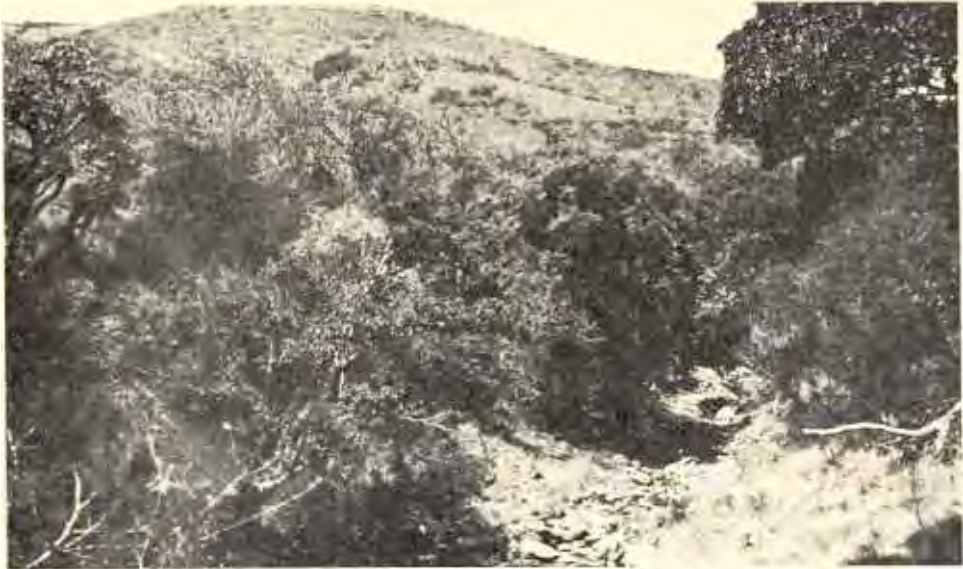
Waar Piet Uys met 12 man van die kop die sloot ingekom het om 'n paar van sy mense te help, waarvan een van sy perd geval het. Die Voortrekkers het met die bergneus op die agtergrond afgekom.