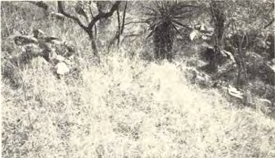
Twee opvallende grafte aangewys deur sakdoeke.

Ons wou dié waarnemings eers nie ophaal nie, maar met die oog op latere navorsing is hulle tog interessant.