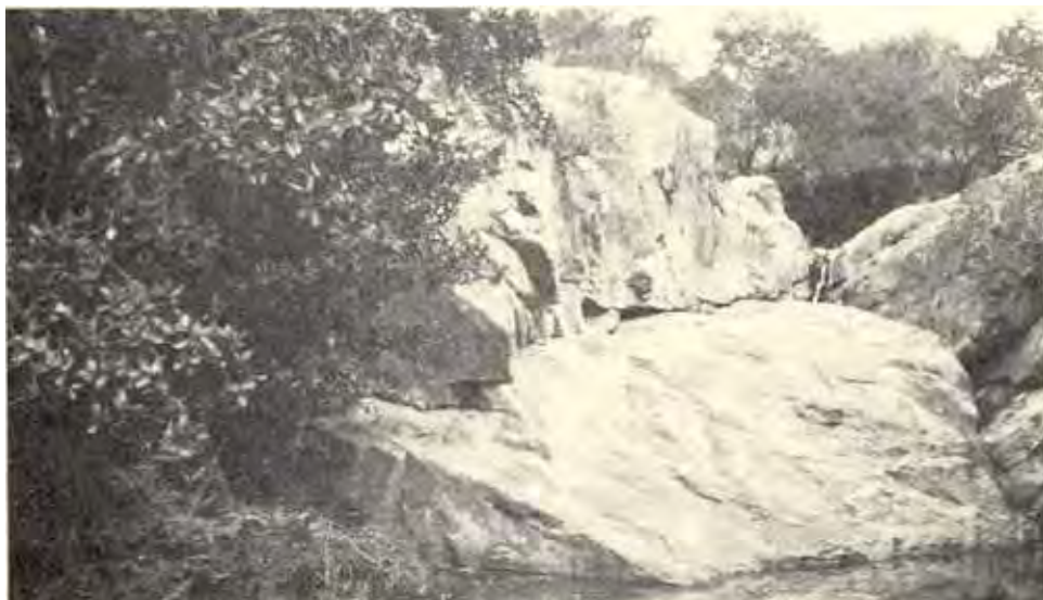
Rotsmuur oor spruit sowat 13 voet hoog (links). Grafte lê duskant links teen helling van spruit.

By 'n tweede besoek van die slagveld het ons ondersoek ingestel na grafte ongeveer 'n halfmyl daarvandaan. Dit het egter gou geblyk dat dit Zoeloegrifte was. Die ou Zoeloegewoonte was om die liggaam in 'n sittende houding te begrawe en 'n plat klip bokant die kop te lê. Daarna het 'n boer, wat op daardie plaas grootgeword het, op 8 Julie 1958 ons vergesel na die rotsmuur in die poort. Toe het ons aan hom verduidelik dat die grafte naby hierdie plek moet wees. Toe ons die helling van die spruit daar uitloop, val ons oog op twee langwerpige grafte wat ooswes lê. Die boer het nooit tevore daarvan notisie geneem nie. By verdere ondersoek het dit geblyk dat daar sowat sewe aanduidings