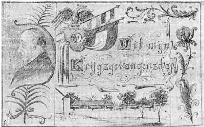
Uit mijn krijgsgevangenschap

Ons keer nou terug na sy lewe as krygsgevangene op Ceylon. Beskrywings oor die kampelewe kon ons nie van sy hand terugvind nie, maar sy album wat gevul is met tekeninge en foto's, gee 'n duidelike beeld van die lewe onder die krygsgevangenes. En die foto's is op besonder