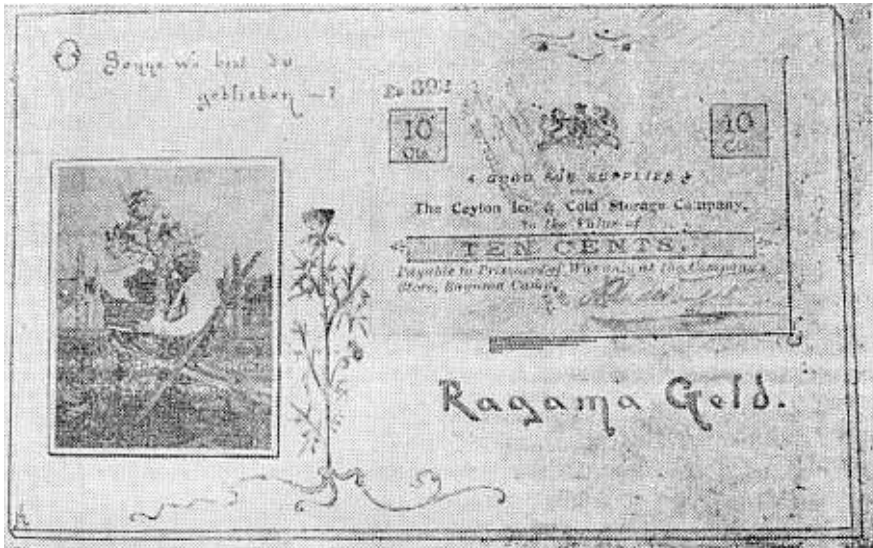
Ragama-Geld met foto van F. E. O. Mörs tydens krygsgevangeneskap

Voordat op die kampelewe soos dit in die album uitgebeeld is, ingegaan word, eers 'n paar verdere feite oor sy lewe. Hy het verlov van die kampowerheid ontvang om van 10 Oktober tot 10 November 1900 teen betaling van een rupee per maand 'n boekwinkeltjie vir die verkoop van skryfgereedskap te onderhou. Hy is van 1 tot 31 Oktober 1902 op parool uitgelaat om Colombo te besoek. Tydens die Britse koninklike besoek aan Ceylon het hy 'n prag-album vervaardig en dié is as souvenir die Prins aangebied. 'n Verslag hieroor verskyn in The Ceylon Standard van 1 November 1902. Mörs het blykbaar 'n tydelike betrekking in die staatsdrukkery in Colombo aanvaar. Op 14 Oktober 1902 is as voorwaarde vir sy vrylating gestel dat hy slegs tydelik na Pretoria sal terugkeer „with a view to settle his affairs there before taking up permanent residence in Ceylon”.