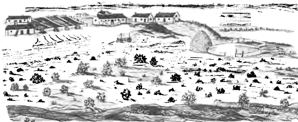
“Berg Rivier, plaats van M. Melck van de Oost Zyde gesien. Tekening van R. Gordon. (K A, V C 237, nr. 8)

Op die Retiefs se plaas, “Oliphantskop” was daar 'n kraal vir die vee. Ten spyte hiervan het 'n wolf 'n lam doodgebyt. Roofdiere was dus nog nie uitgeroei nie. Omdat daar gesaai is, sou daar 'n dorsvloer gewees het; verder huisvesting vir die slawe en