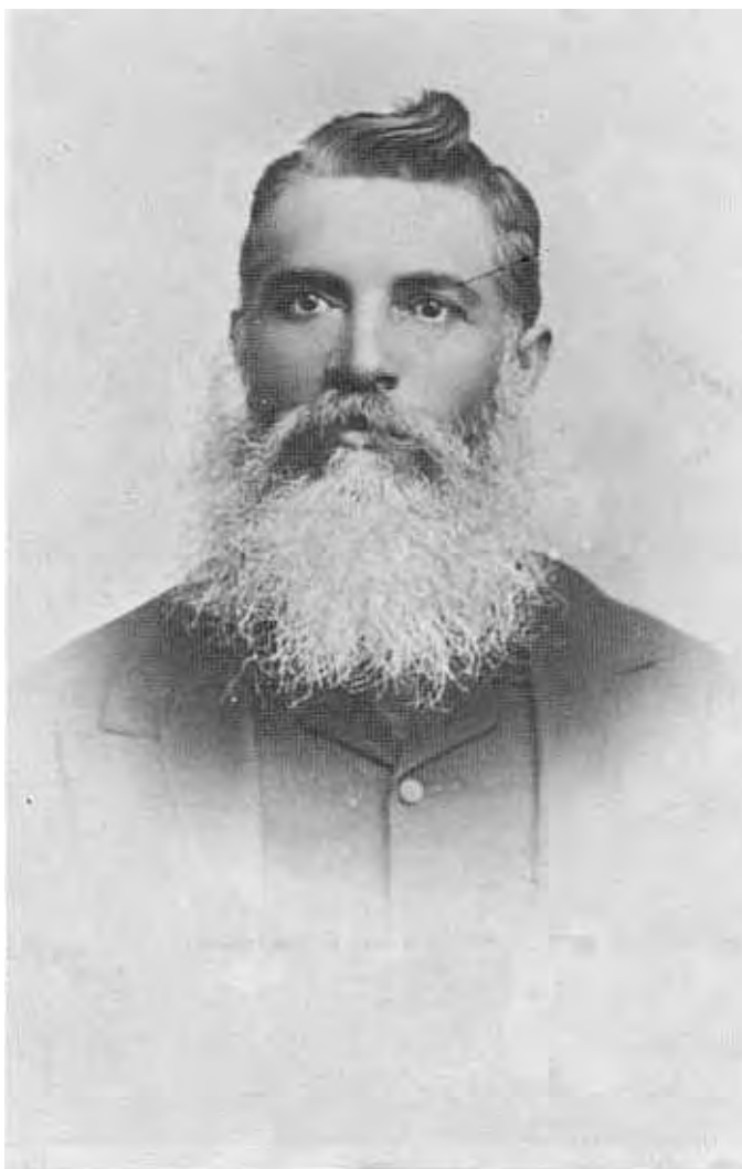
J P L Pretorius, 1842 — 1907