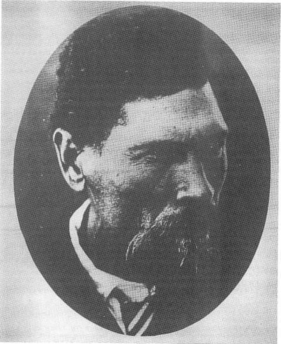
Hermanus van Wyk, eerste Kaptein van die Rehoboth-Basters.