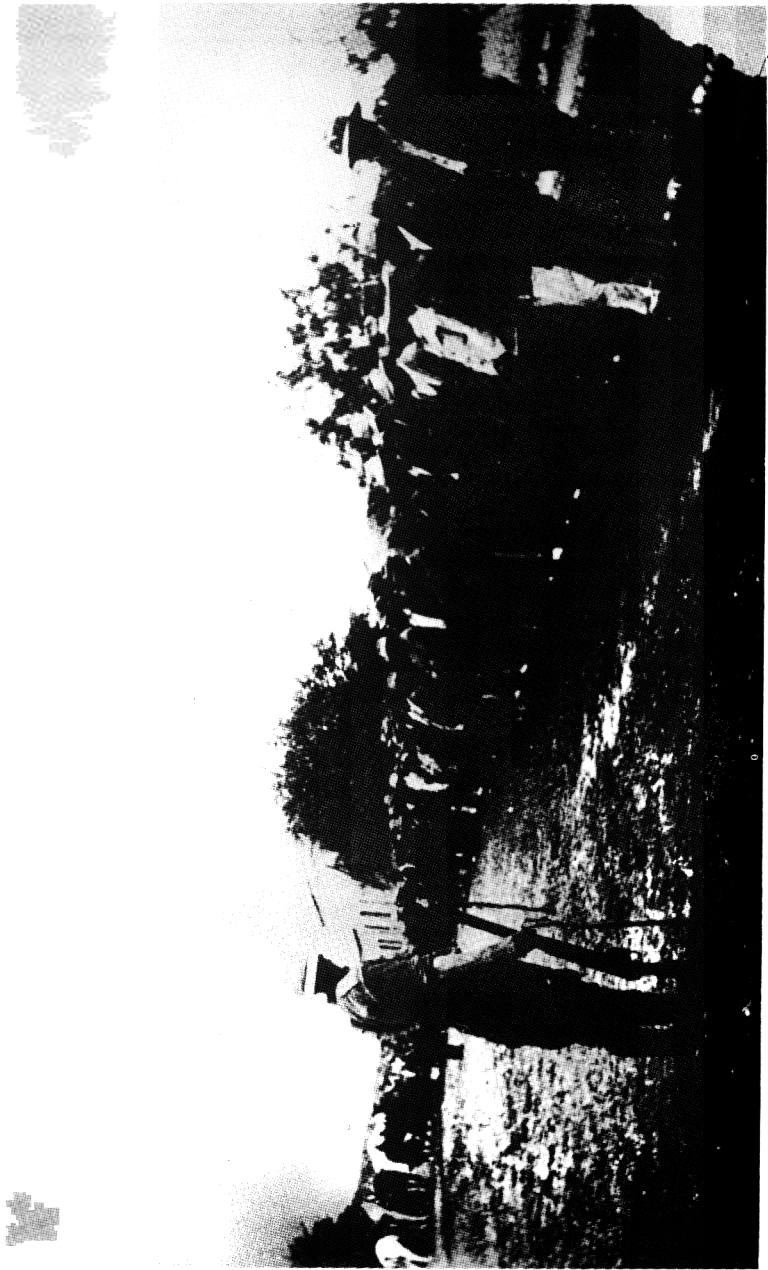
Polisie bewaak Bastergevangenes, prii 1925