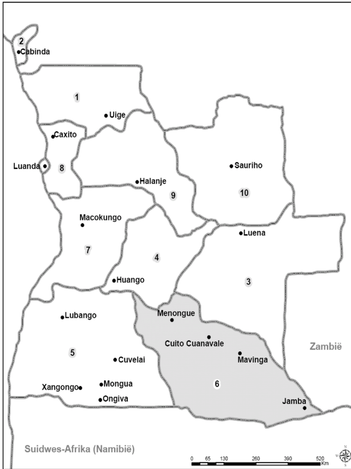
Figuur 1: Angola – militêre streke. 23