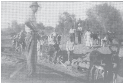
Figuur 2: Donkiespanne sleep boomstompe weg. 86

Bome uithaal was die eerste aspek van die voorbereiding van die eiland vir landboupoduksie. Dit was ontsettend harde werk om bome, veral reuse ou kameeldoringbome ( Acacia erioloba ) 84 uit te haal. W.F. Hanzen, wat sy pa as opgeskote seun gehelp het om bome uit te haal, vertel watter reuse taak dit was. Dit het weke geneem om 'n groot boom se wortels oop te grawe en af te kap en dan die boom met 'n span donkies om te trek, dit uit die gat te lig en die gat weer toe te gooi. Die boom is in stompe gekap en weggesleep of opgesaag vir brandhout. Die hele proses het ongelooflike harde werk geveg. 85