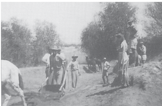
Figuur 3: Die kanaalwalle word opgesleep met bakskraper. 96

Die grond is finaal met die plankskraper of blokskraper “gedress”. 97 Die plank- of blokskraper, bekend as die Kakamasplank, is deur die nedersetters van Kakamas na aanleiding van die groot houtskoffel wat deur osse of donkies getrek is, ontwerp en eerste daar gebruik. 98 Cornelissen beskryf die implement só: “Dit is ’n werktuig van plank – 1’6” breed en 5’-7” lank met twee sterre om dit te hanteer, en ’n staal lem van 5” om dit maklik in die grond te laat ingaan. Die blok steek ’n baie groot vrag op ’n keer en daarmee kan ’n groot klomp grond per dag weggesleep word, van die hoër na die laer dele.” 99