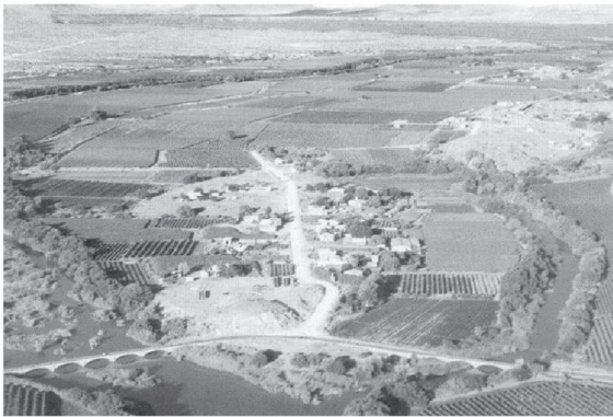
Figuur 4: Lugfoto van Skanskopeiland in die 21ste eeu. 123

Vandag omsom gevestigde wingerd en wisselbou die kronkelende oevers van die rivier in die Benede-Oranje en lewer die gebied, waarvan Skanskopeiland deel is, nasionaal en internasionaal 'n daadwerklike bydrae tot die land se ekonomie. 121 Dit word bereik, nie net deur op 'n volhoubare vlak werk te verskaf aan die plaaslike bevolking nie, maar ook deur die toetrede tot die Suid-Afrikaanse wyn- en internasionale droogdruiwproduksie, waardeur daar ook verskeie beroepsmoontlikhede vir jongmense, wat oor die nodige vaardigheid en opleiding beskik, gebied word. 122 Die grondslag daarvan is egter deur die volharding van die pioniernedersetters gelê.